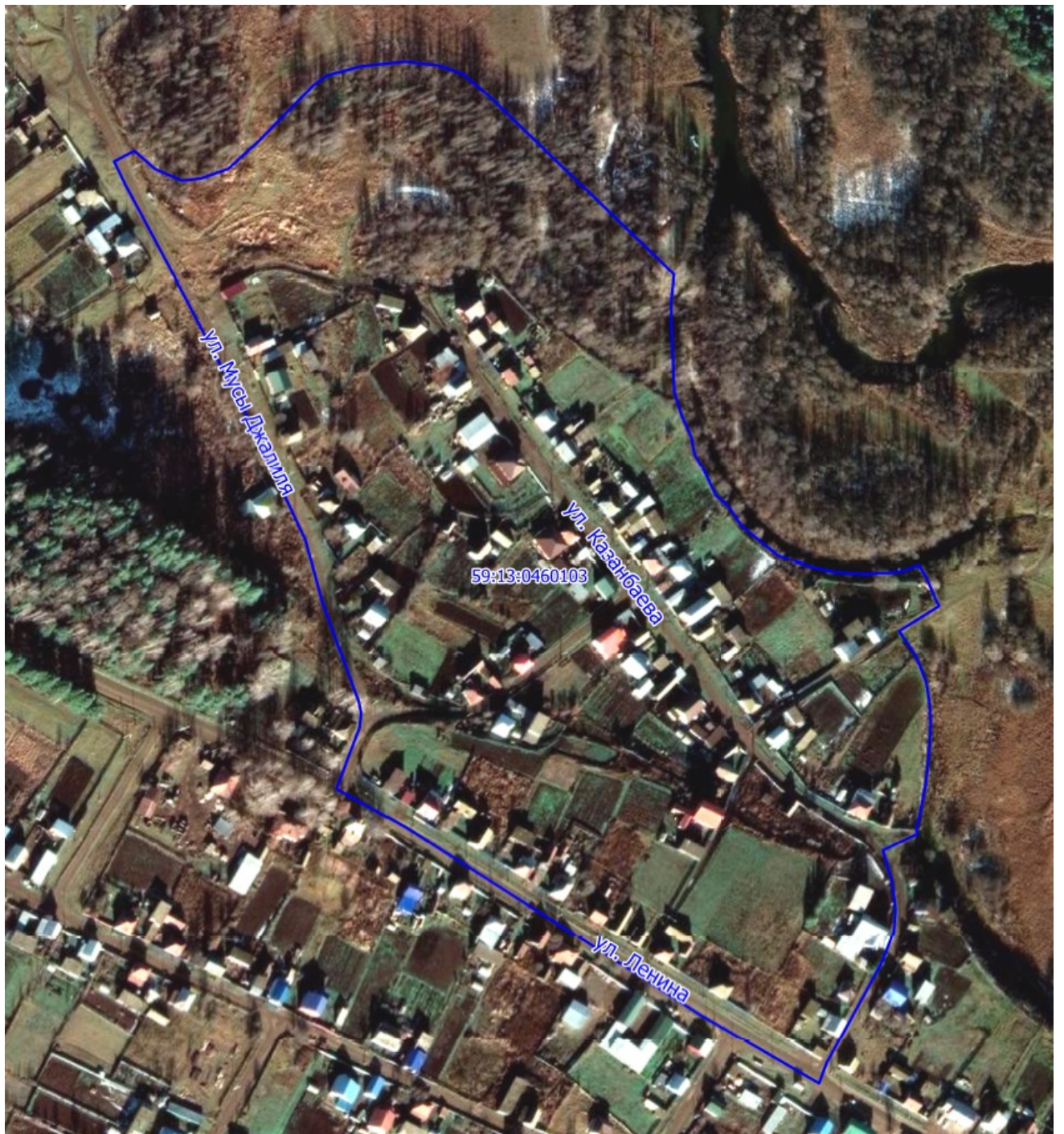
Рис. 1 Местоположение территории кадастрового квартала 59:13:0460103