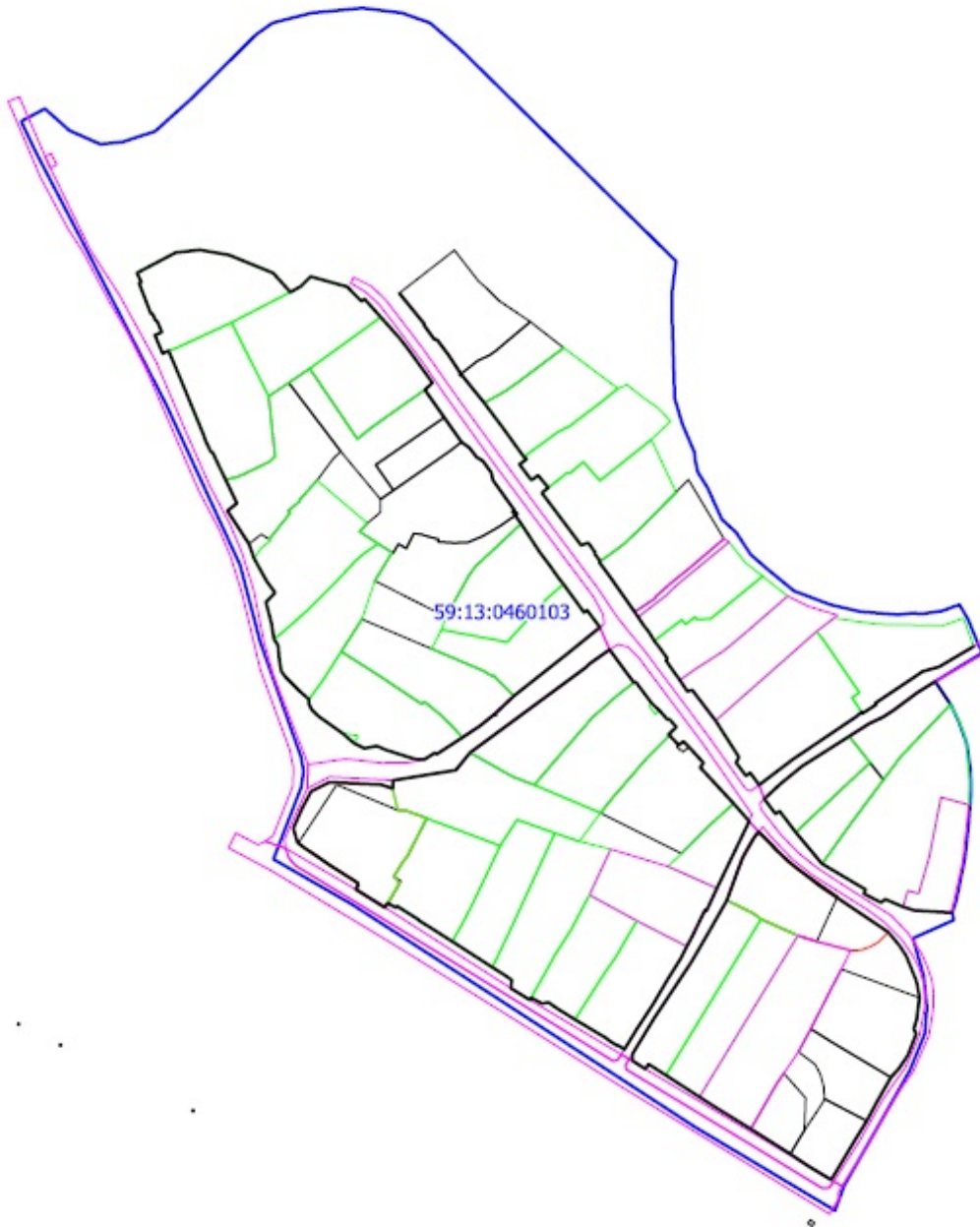
Рис.4 Местоположение утверждаемых красных линий

Проектом межевания территории предусматривается уточнение земельных участков (в том числе путем исправления реестровой ошибки). Указанная информация представлена в таблице 2, графическая часть отображена на чертеже межевания территории.