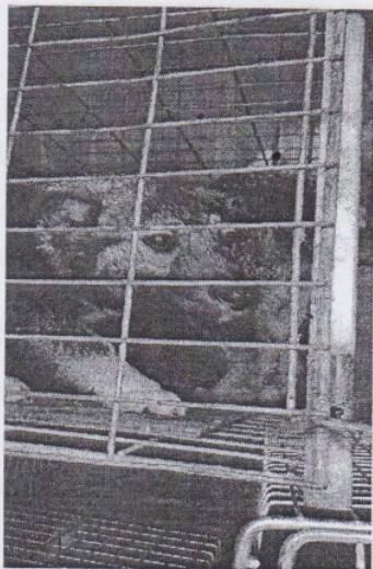
(место для фото)