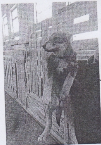
(место для фото)