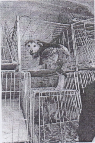
(место для фото)