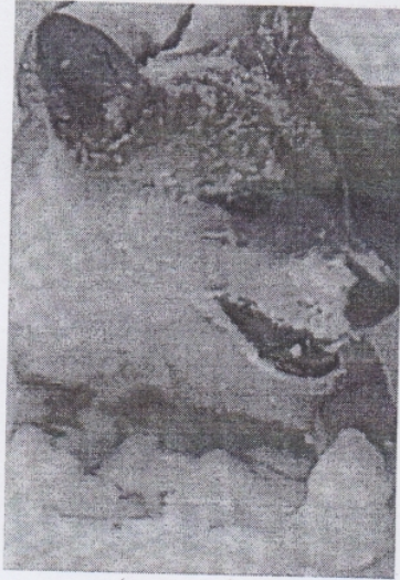
(место для фото)