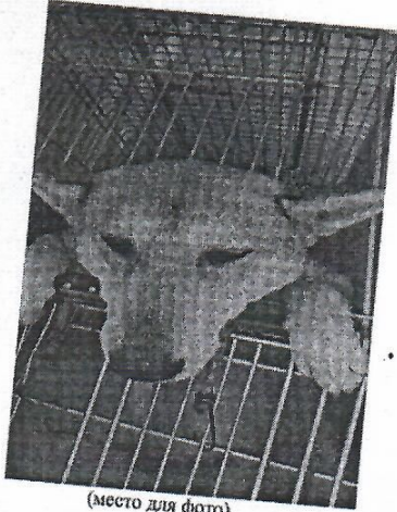
(место для фото)